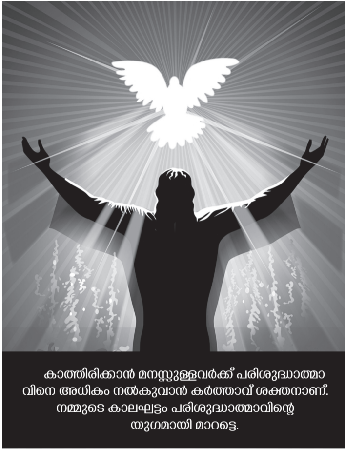
കാത്തിരിക്കാൻ മനസ്സുള്ളവർക്ക് പരിശുദ്ധാത്മാവിനെ അധികം നൽകുവാൻ കർത്താവ് ശക്തനാണ്. നമ്മുടെ കാലഘട്ടം പരിശുദ്ധാത്മാവിന്റെ യുഗമായി മാറട്ടെ.

പരിശുദ്ധാത്മാവിനും ഒന്നാം സ്ഥാനം നൽകിയാൽ നാം വിജയിക്കും. ലജ്ജമൂടാതെയുള്ള ജീവിതം നയിക്കുവാനുള്ള കരുത്ത് അപ്പോൾ ലഭിക്കും. ദൈവത്തോടു ചോദിക്കാത്ത താമസമേയുള്ളൂ, ലഭിക്കുവോളം